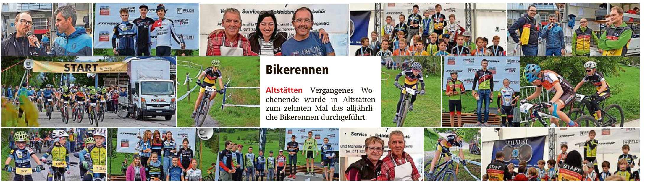
Für Sie unterwegs war: partyfun.ch

Marbach Die beliebte Manhattan Cocktailparty ging vergangenen Samstag in die letzte Runde. Unter dem Motto «Back to the roots» wurde im Stil der 80er- und 90er-Jahren ausgelassen gefeiert. Der Anlass wurde vom Verein Impuls organisiert.