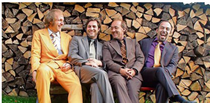
«The Mozzarellas»: Romantisch, virtuos, charmant und erbarmungslos.