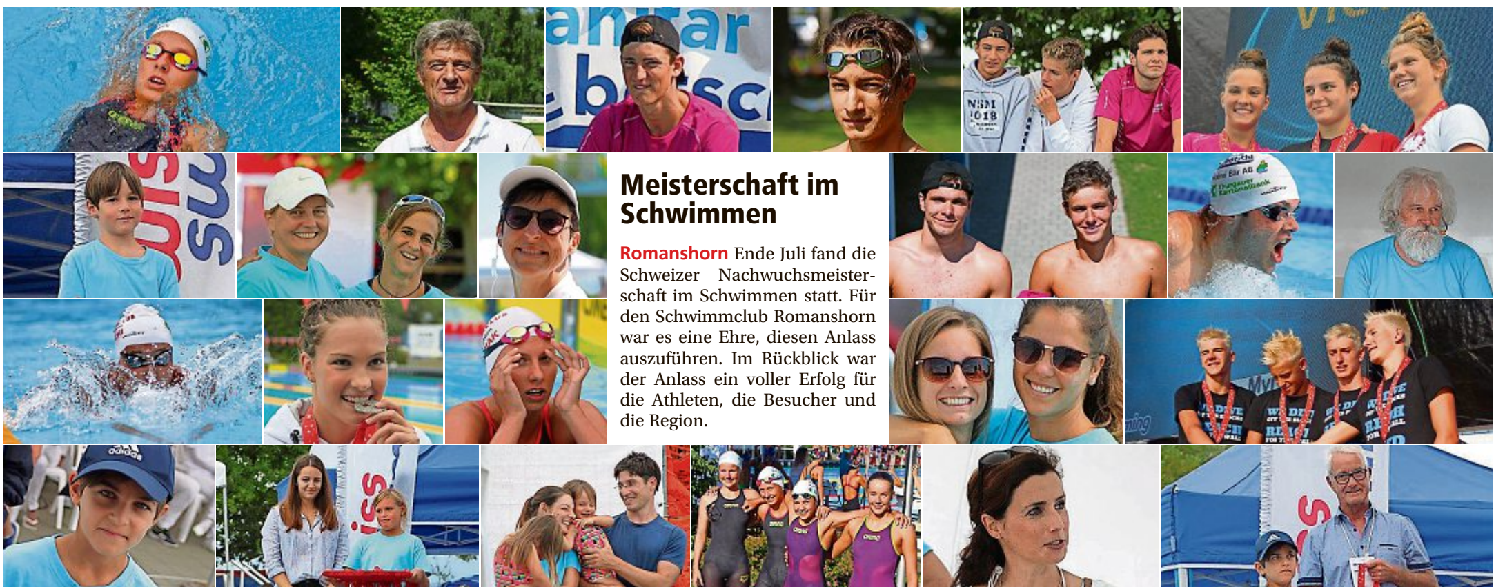
Für Sie war unterwegs: partyfun.ch

Amriswil Am Freitag und Samstag, 20. und 21. Juli, fand in Amriswil die traditionelle Siebenschläferparty statt. Neben den DJs sorgten verschiedene Showacts für Staunen und perfekte Stimmung. Die Gäste feierten ausgelassen bis in die frühen Morgenstunden.