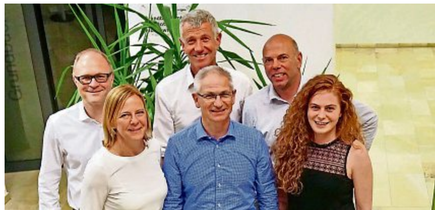
Die sechs nominierten Kandidierenden

Frauenfeld Vom 1. Oktober 2018 bis 31. März 2019 gaben 2'389 Schüler bei Verkehrskontrollen der Kantonspolizei Thurgau die Wettbewerbstalons einem Polizisten ab. Durch das Tragen der Leuchtwes-