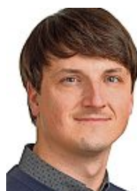
Marc Kipfer. z.v.g. Übersetzungs-

Dabei kann es auf dem Fluss schnell gefährlich werden. Das Schlauchboot kann Luft verlieren, kentern, man kann ins kalte Wasser fallen, gegen Brückenpfeiler prallen oder in eine starke Strömung geraten - in all diesen Fällen kann die Rettungsweste eine Lebensversicherung sein. Gute Westen drehen den Menschen im Wasser automatisch auf den Rücken. Auch eine ohnmächtige Person hat dadurch freie Atemwege und kann gerettet werden. Von den jährlich fünf tödlichen Bootsunfällen könnten laut der bfu vier verhindert werden, wenn alle eine Rettungsweste nicht nur im Boot mitführen, sondern jederzeit tragen würden.