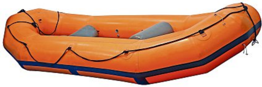
Die bfu hat acht Gummiboote von verschiedenen Anbietern getestet.